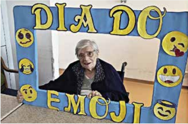
Dia do emoji (21/07/2025)