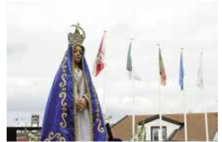
Missa em honra de Nossa Senhora dos Remédios (21/07/2025)