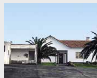
Imóvel para construção da creche