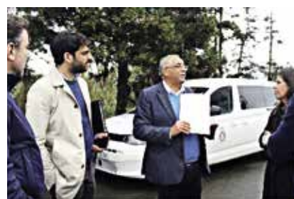
Visita da Diretora Regional da Solidariedade Social