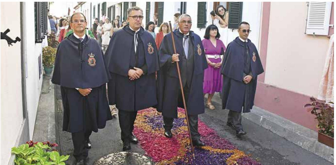
Procissão em honra de Nossa Senhora do Rosário (12/10/2025)