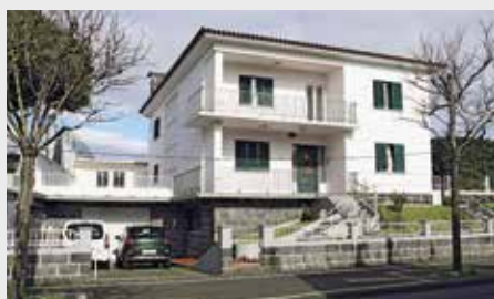
Casa de Acolhimento Residencial de Crianças e Jovens e Loja Solidária

25 anos de cuidado, partilha e proximidade