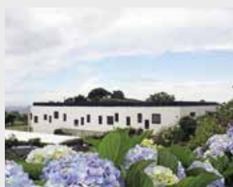
Centro de Atividades e Capacitação para a Inclusão e Lar Residencial