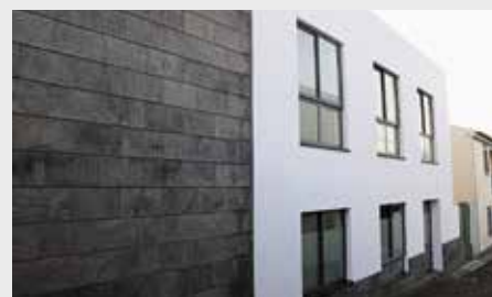
Centro de Atividades de Tempos Livres