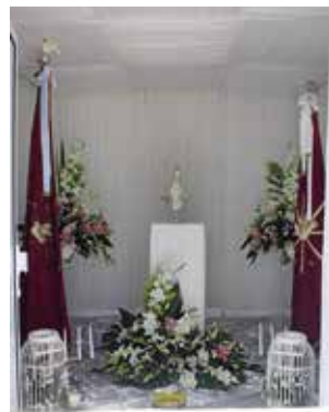
Abertura e bênção do quarto do Divino Espírito Santo (06/06/2025)