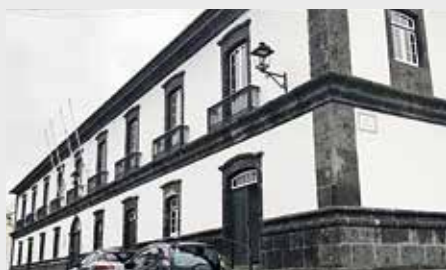
Centro de Convívio para Idosos de Água de Pau