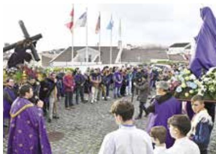
Encontro de Nossa Senhora das Dores na procissão do Senhor dos Passos (16/03/2025)