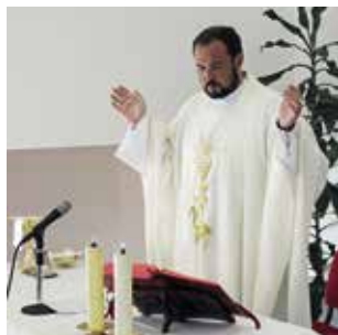
Eucaristia da Última Ceia do Senhor (16/04/2025)

Na Semana Santa, alguns utentes dos Centros de Convívio para Idosos e do Lar de Santo António participaram na eucaristia da Última Ceia do Senhor, a convite da Paróquia de Nossa Senhora de Fátima, do Lajedo, em Ponta Delgada.