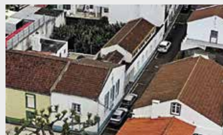
Centro de Convívio para Idosos de Santa Cruz e Programa Novos Idosos