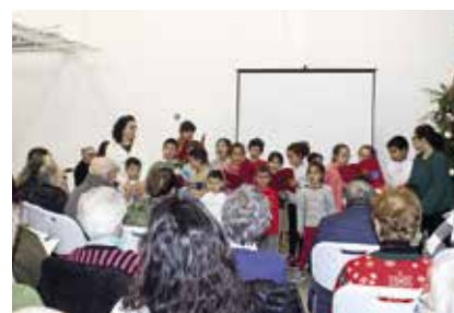
Festa de Natal dos Centros de Convívio para Idosos e do Programa Novos Idosos (17/12/2025)