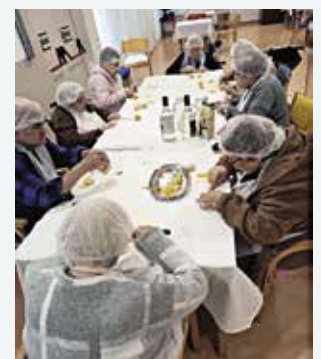
Elaboração de licores tradicionais para o Natal (08/12/2025)