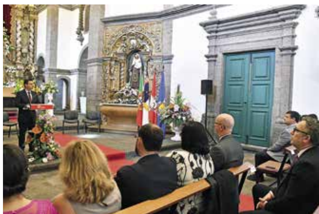
Sessão solene de abertura das Festas de Santo António 2025 (09/06/2025)