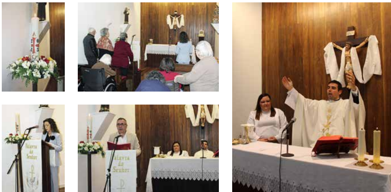
Eucaristia do Domingo da Ressurreição do Senhor (20/04/2025)