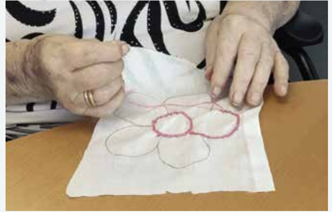
Comemoração do dia do bordado (30/07/2025)