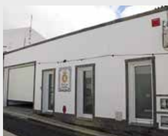
Casa da Partilha