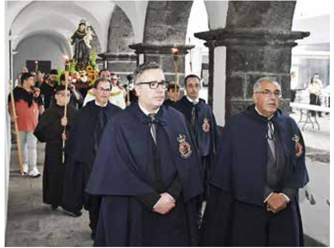
Eucaristia e procissão em honra de Santo António (13/06/2025)