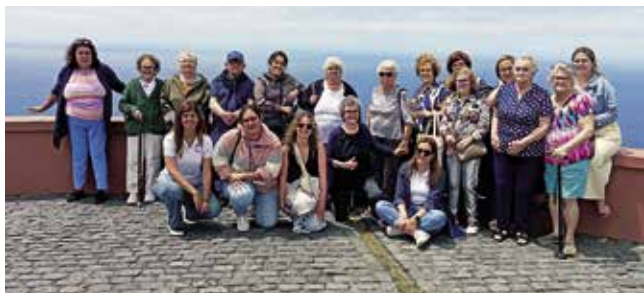
Sete Cidades (08/07/2025)

Houve momentos de alegria, boa disposição e oportunidades de confraternização, reforçando o espírito de grupo e promo-