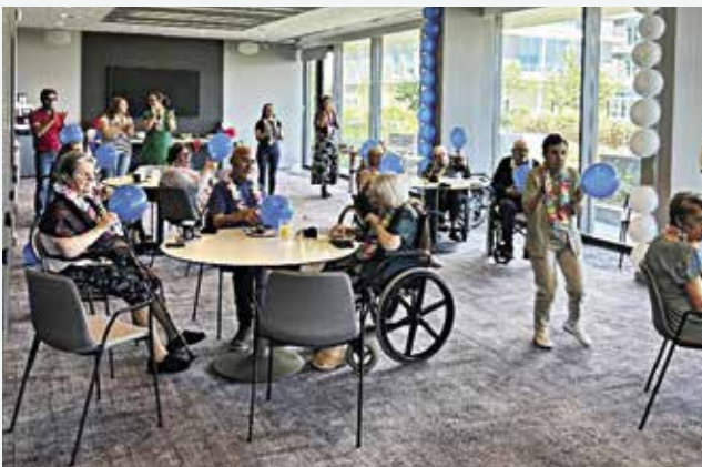
Visita ao hotel DoubleTree by Hilton Lagoa (20/08/2025)