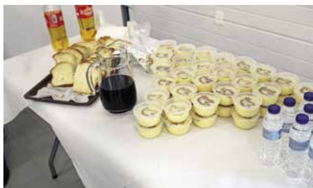
Abertura e bênção da despensa da carne, do pão e da massa (06/06/2025)

No sábado, dia 7, a tradição manteve-se no Lar de Santo António com uma eucaristia. Foram coroadas todas as pessoas que participaram, incluindo funcionários, utentes e familiares.