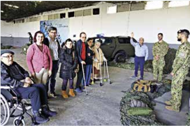
Visita ao Campo Militar de São Gonçalo