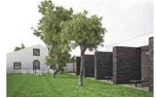
Projeto em 3D concebido pela empresa M-Arquitetos, Lda.