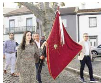
Mudança da bandeira e da coroa para o quarto do Divino Espírito Santo (06/06/2025)