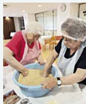
Oficina da culinária (30/10/2025)