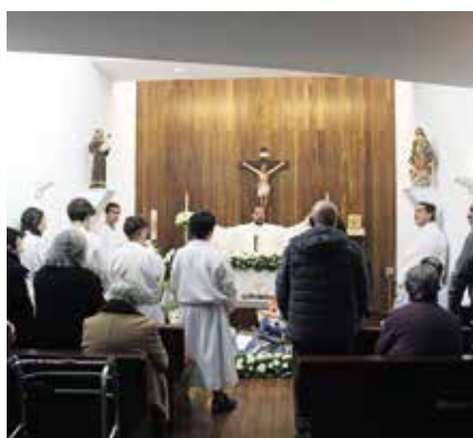
Eucaristia de encerramento do Sagrado Lausperene (30/03/2025)