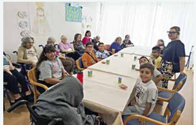
Dia dos Avós, com a presença do grupo de crianças do CATL (17/09/2025)