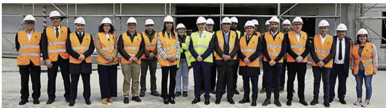
Visita do Presidente do Governo Regional dos Açores e da Secretária Regional da Saúde e Segurança Social