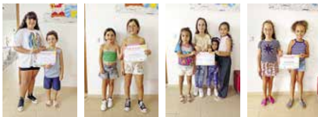
Concurso “O CATL tem talento”

O Centro de Atividades de Tempos Livres (CATL) da Misericórdia tem realizado diversas atividades com as crianças e jovens, das quais se inserem no projeto educativo “A brincar também se pode aprender”.