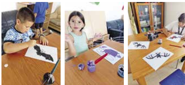
Atividades alusivas ao Halloween (31/10/2025)