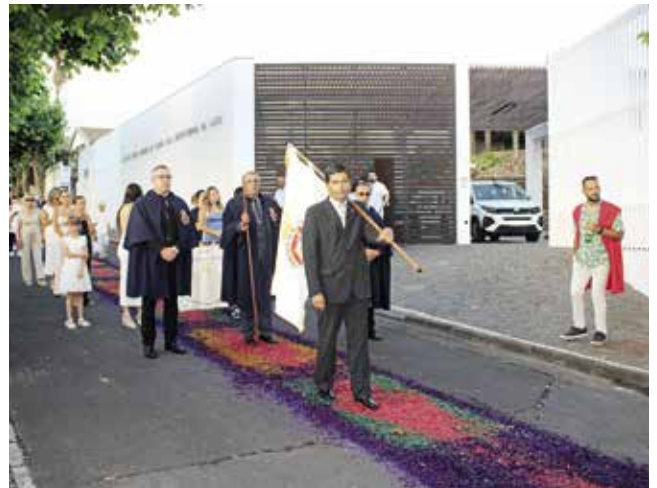
Procissão em honra do Sagrado Coração de Jesus e de Nossa Senhora do Rosário (03/08/2025)