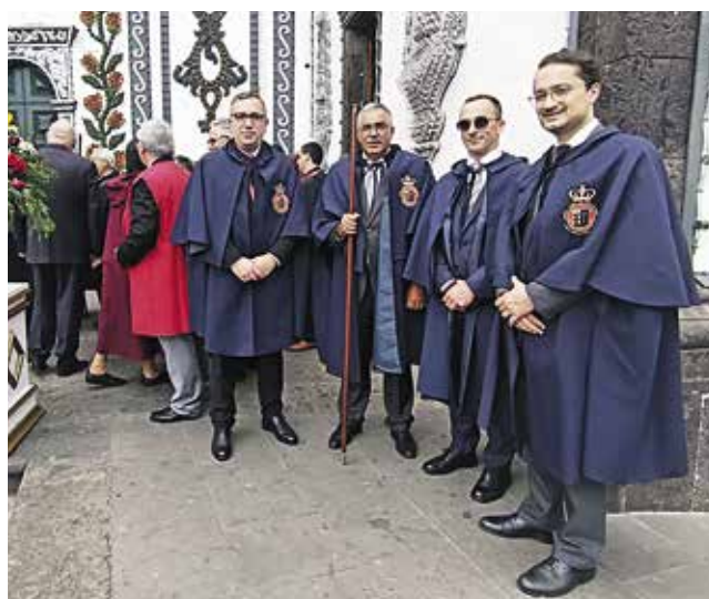
Procissão em honra do Senhor Santo Cristo dos Milagres (25/05/2025)