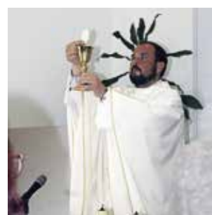
Eucaristia da Última Ceia do Senhor e lava-pés (17/04/2025)