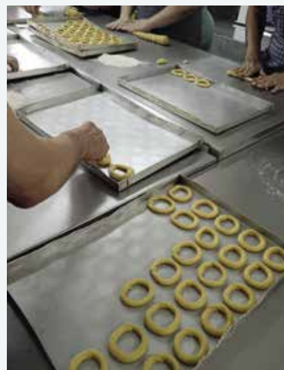
Visita à Megasil - Cooperativa de Produção Alimentar (15/07/2025)