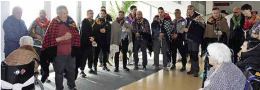
Visita do rancho de romeiros de Santa Clara (11/04/2025)

No dia 11 de abril, as crianças e a equipa do Centro de Atividades de Tempos Livres (CATL) juntaram--se aos irmãos do rancho de romeiros da paróquia de Santa Clara. Visitaram a capela do Lar de Santo António, e uniram-se em oração com funcionários, utentes e familiares.