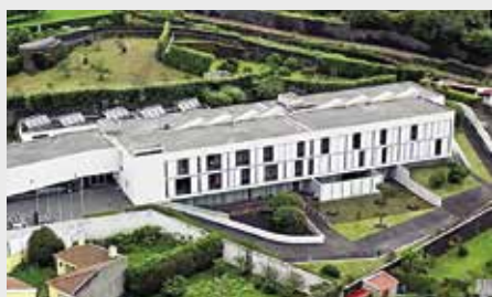
Lar de Santo António (ERPI e UCCI)