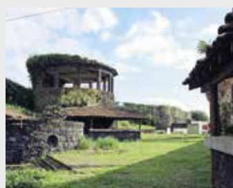
Terreno para construção da UCCI