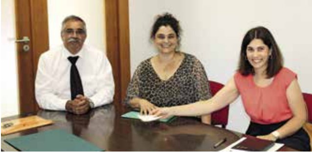
Assinatura da escritura de compra e venda do imóvel para a Creche e Jardim de Infância

A Misericórdia de Santo António adquiriu, em 27 de julho de 2022, um imóvel, situado na Estrada Regional de Santa Cruz, destinado à construção de uma Creche e Jardim de Infância.