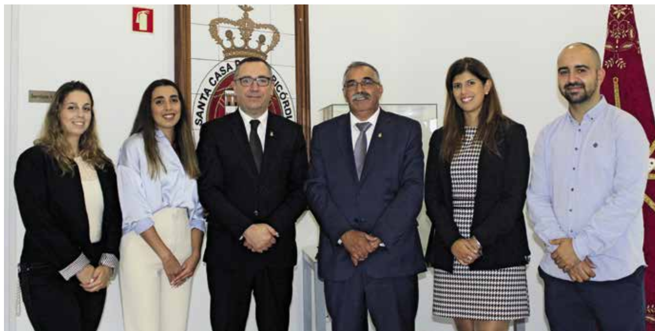
Equipa Técnica Local do Programa “Novos Idosos” (24/10/2023)

O compromisso do Programa reflete-se na abordagem personalizada em adaptar-se às necessidades individuais, garantindo um plano individual de cuidados, elaborado pela Equipa Técnica Local composta por: Assistente Social, Enfermeira, Psicóloga e Técnico Superior de Animação Sociocultural.