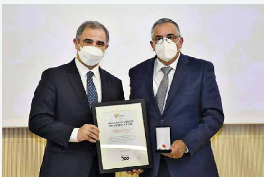
Diploma de Mérito Municipal Social (11/04/2022)

No dia 11 de abril de 2022, no âmbito das comemorações dos 500 anos do concelho de Lagoa, a Câmara Municipal de Lagoa reconheceu a Misericórdia pelo abnegado trabalho de índole social, na promoção do bem-estar e melhoria das condições de vida das pessoas e pela defesa dos direitos cívicos e sociais, através da concretização de valores como a justiça, a solidariedade, a igualdade e a integração social. com um diploma de mérito municipal social. O diploma foi entregue pelo Presidente do Governo Regional dos Açores.