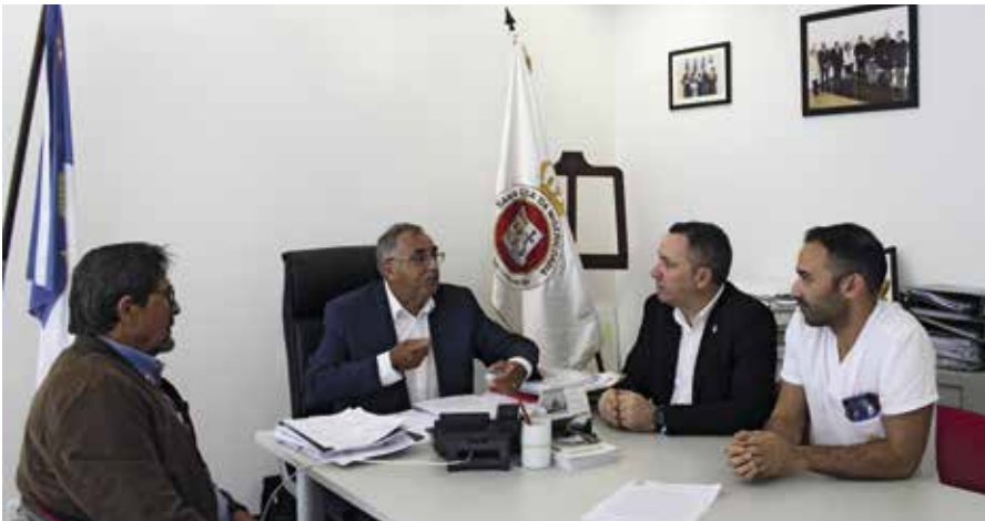
Assinatura do contrato para construção das Instalações de Apoio à Misericórdia (16/06/2023)

Está a decorrer a construção das Instalações de Apoio à Misericórdia, através do financiamento atribuído pela Secretaria Regional do Turismo, Mobilidade e Infraestruturas, mediante a assinatura de um contrato-programa. Prevê-se que a obra fique concluída durante o primeiro trimestre de 2024. Estas instalações irão permitir a realização de eventos e atividades, nomeadamente, as Festas em honra do Divino Espírito Santo, convívios de Natal e a entrega de cabazes de géneros alimentares.