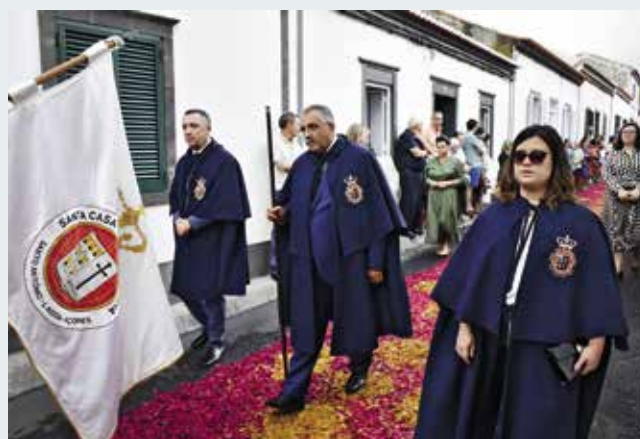
Procissão em honra de Nossa Senhora do Rosário (09/10/2022)