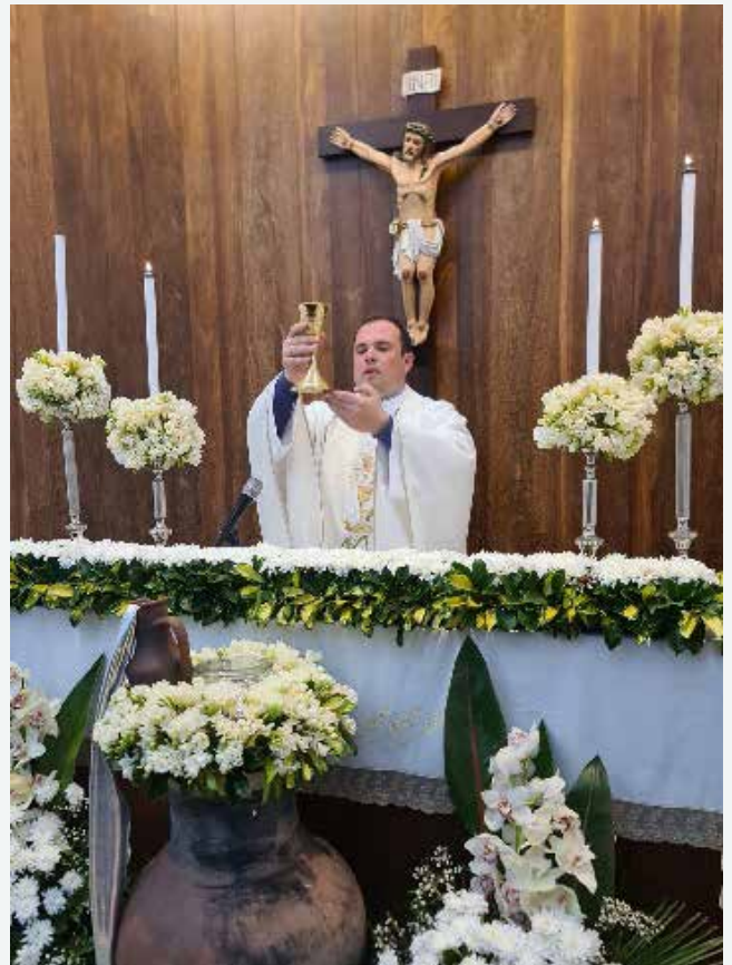
Eucaristia Solene de Encerramento do Sagrado Lausperene (19/03/2023)