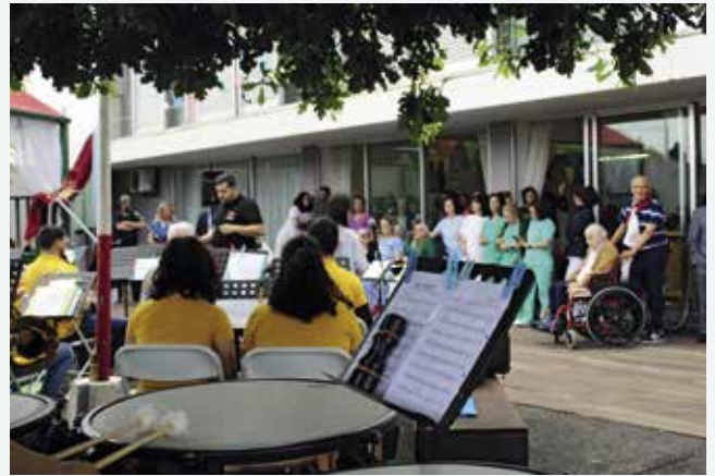
Festa em honra do Divino Espírito Santo