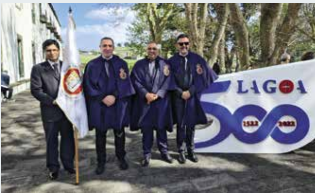
Desfile em homenagem ao concelho de Lagoa pelos 500 anos (25/04/2023)