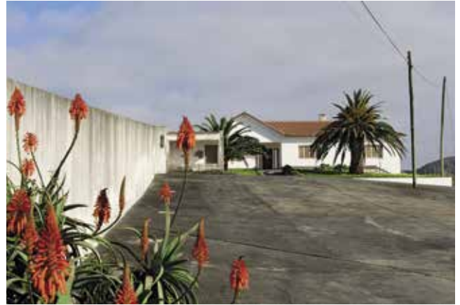
Imóvel destinado à futura Creche e Jardim de Infância