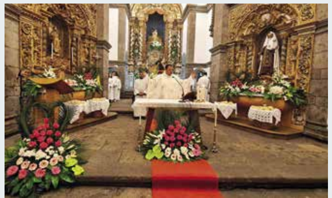
Missa Solene em honra da Imaculada Conceição (08/12/2023)