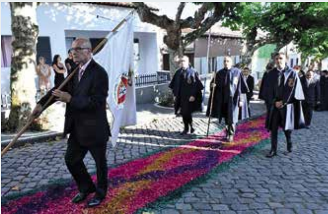
Procissão em honra do Sagrado Coração de Jesus e Nossa Senhora do Rosário - Matriz de Santa Cruz (30/07/2023)