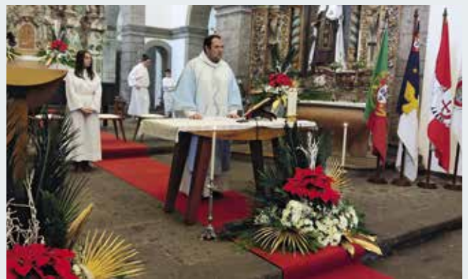
Missa Solene em honra de Santo António (12/06/2023)