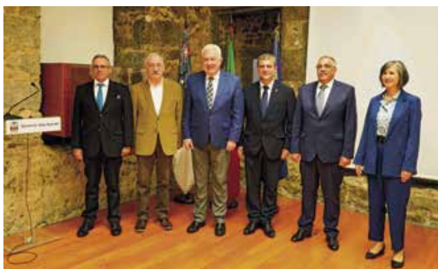
Assinatura do contrato do Programa “Novos Idosos” (03/03/2023)

Os cuidadores desempenham um papel fundamental, proporcionando um suporte essencial para garantir que os idosos recebem a atenção e os cuidados necessários no seu domicílio.