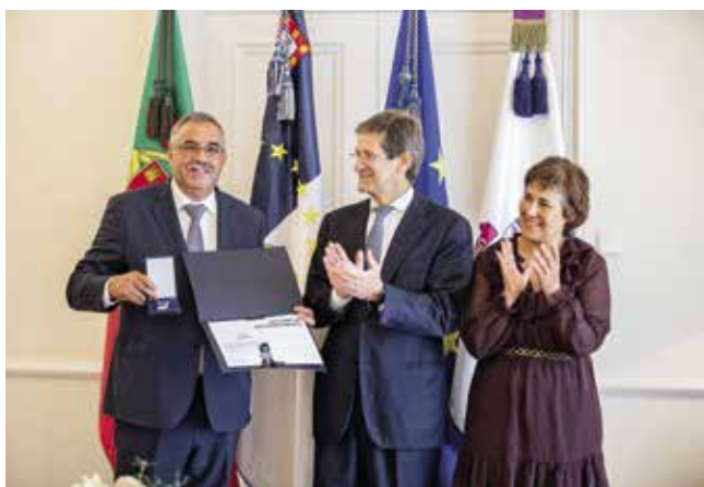
Medalha de reconhecimento institucional - Universidade dos Açores (24/05/2022)

O Lar de Santo António recebeu um diploma de reconhecimento institucional pelos serviços prestados à Universidade dos Açores no âmbito da formação de estudantes da Licenciatura em Enfermagem, na componente de ensino clínico, durante o período de pandemia de COVID-19.