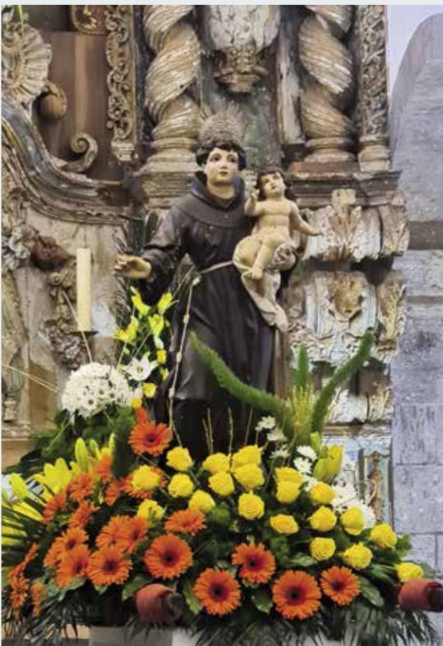
Imagem de Santo António