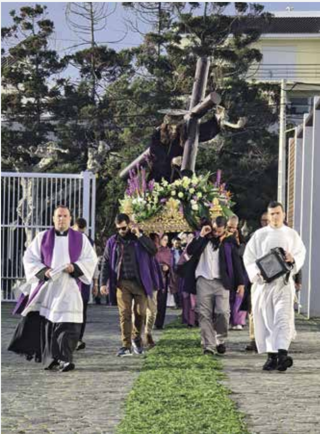
Entrada do Senhor dos Passos no Lar de Santo António (05/03/2023)