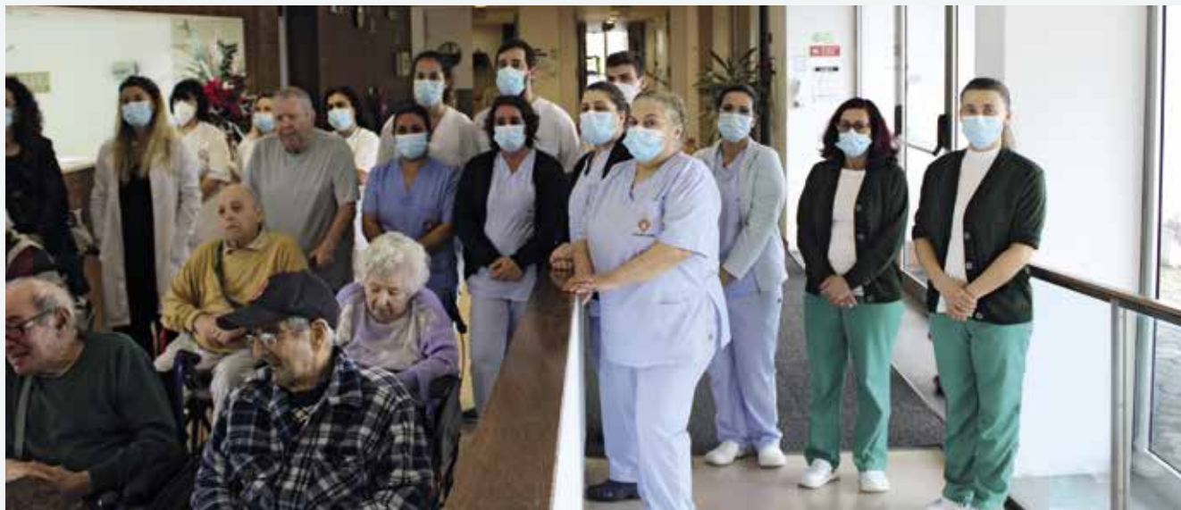
Aniversário da Santa Casa da Misericórdia de Santo António de Lagoa (12/01/2023)